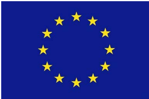
COMISIÓ EUROPEA Representación en España